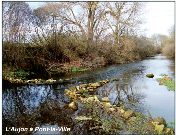
L'Aujon à Pont-la-Ville