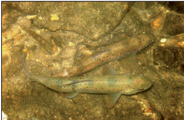
Truites fario de la Coulange

Dépositaire : Rivière-les-Fosses : Jean-Pierre Bégin Tél. : 03 25 84 82 81