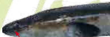
Oeil hypertrophié (gonflé)