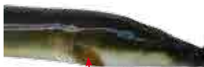
Nageoire pectorale courte