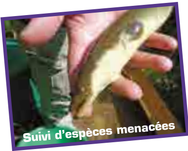
Suivi d'espèces menacées

L'étude des habitats et des populations permet de mieux connaître nos rivières et ainsi de pouvoir les préserver.