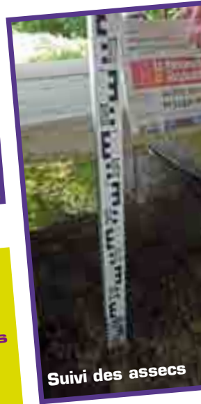
Suivi des assècs

L'étude des habitats et des populations permet de mieux connaître nos rivières et ainsi de pouvoir les préserver.