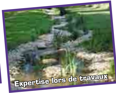
Expertise lors de travaux