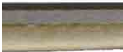
Ventre plus ou moins jaune