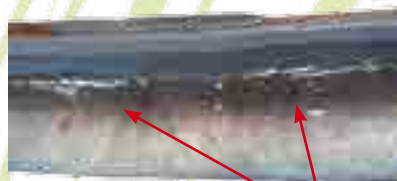
Ventre plus ou moins blanc